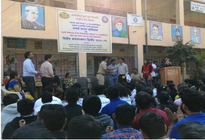
Interaction with NSS Volunteers